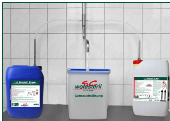
Herstellung der Gebrauchslösung mit dem WOFA-TEC® DI2