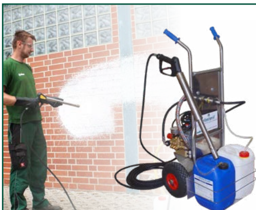
Hochdruckschaum mit dem WOFA-MAT® Desinfektionssystem